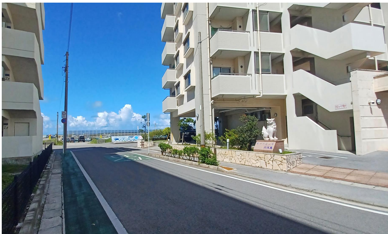
玄関エントランス